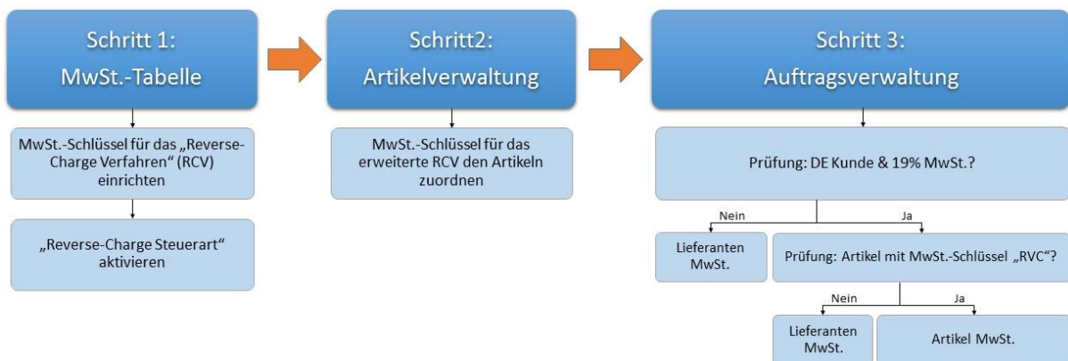
Abbildung 7: Ablaufdiagramm II (Rechnungseingangsbuch)