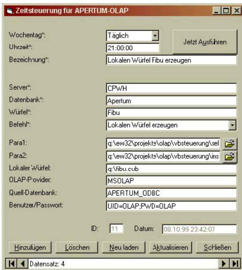
Abbildung 3: Zeitsteuerung eEvolution OLAP

Das Menu <Zeitsteuerung> bietet zahlreiche Möglichkeiten zur automatisierten Erzeugung der lokalen Cubes: