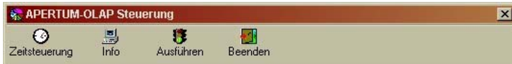
Abbildung 2: Hauptmenü eEvolution OLAP

Der Bereich <Info> dient zur Kontrolle der Datenbankstruktur und zeigt sämtliche Würfel, die letzte Aufbereitungszeit sowie alle Dimensionen der Datenbank an.