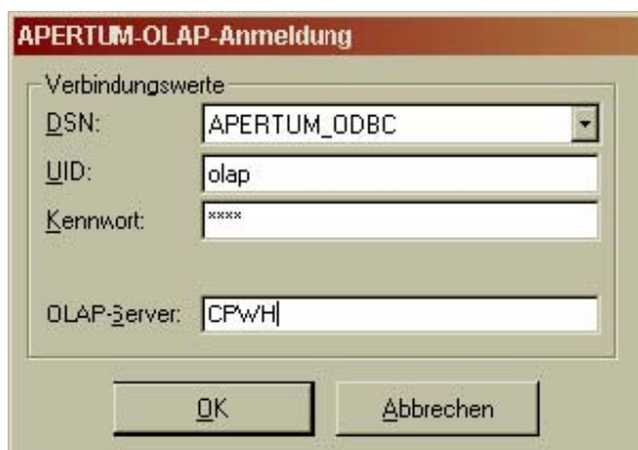
Abbildung1: Login Bildschirm von eEvolution OLAP

Das Modul ist, wie in eEvolution gewohnt, passwortgeschützt: